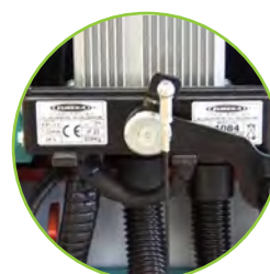
Carregador de baterias